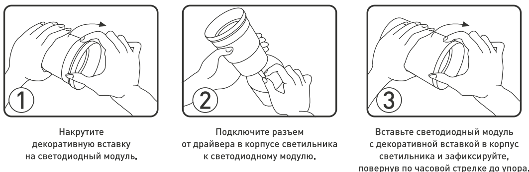
Рисунок 1. Сборка светильника.