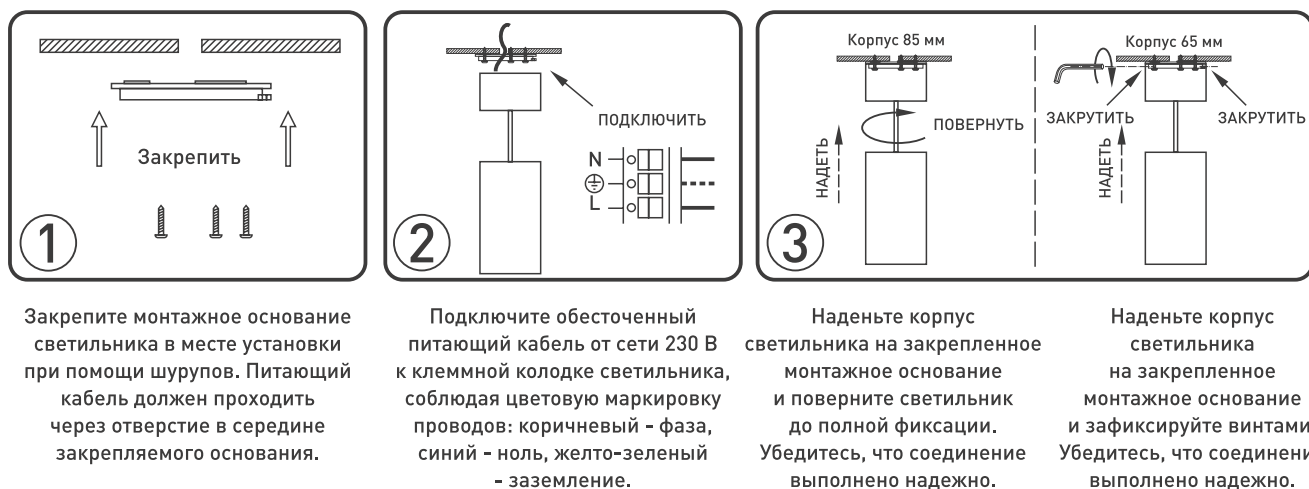
Рисунок 2. Установка светильника.